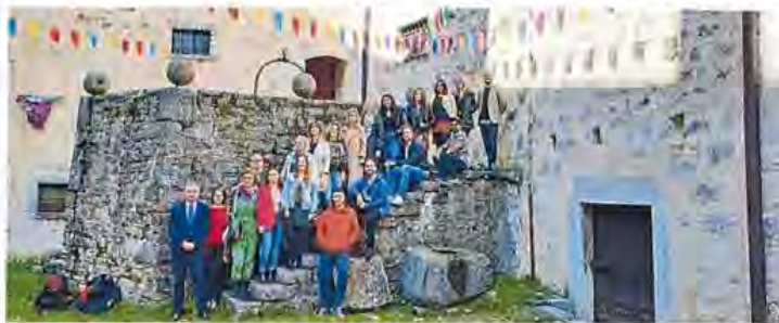
Digitalni nomadi, mentori i organizatori u pozivinskom Kaštelu